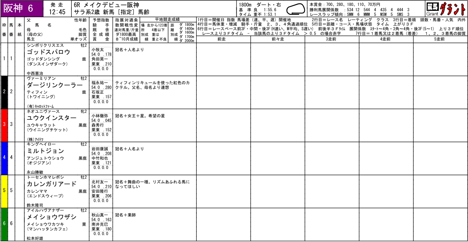
阪神ダート1800m種牡馬成績