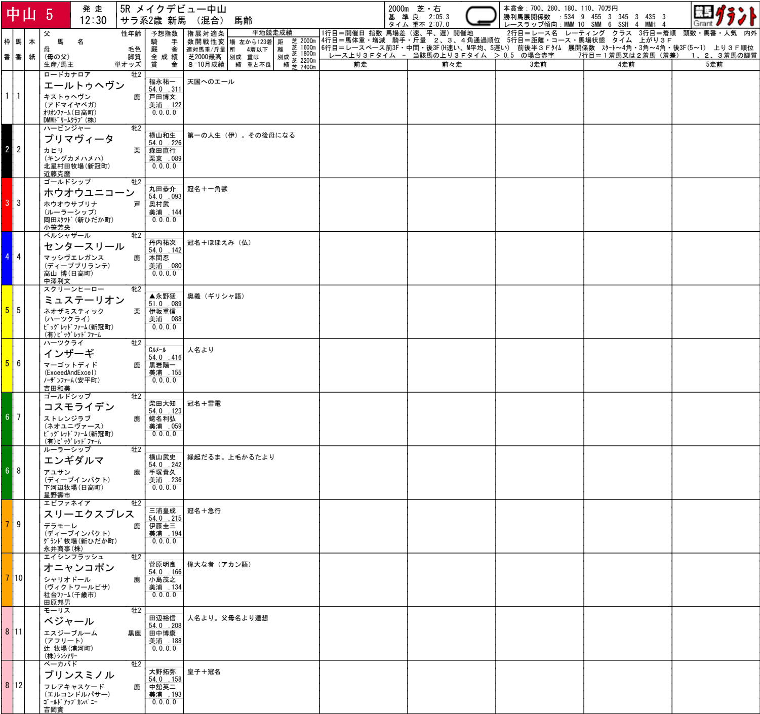
中山芝2000m種牡馬成績