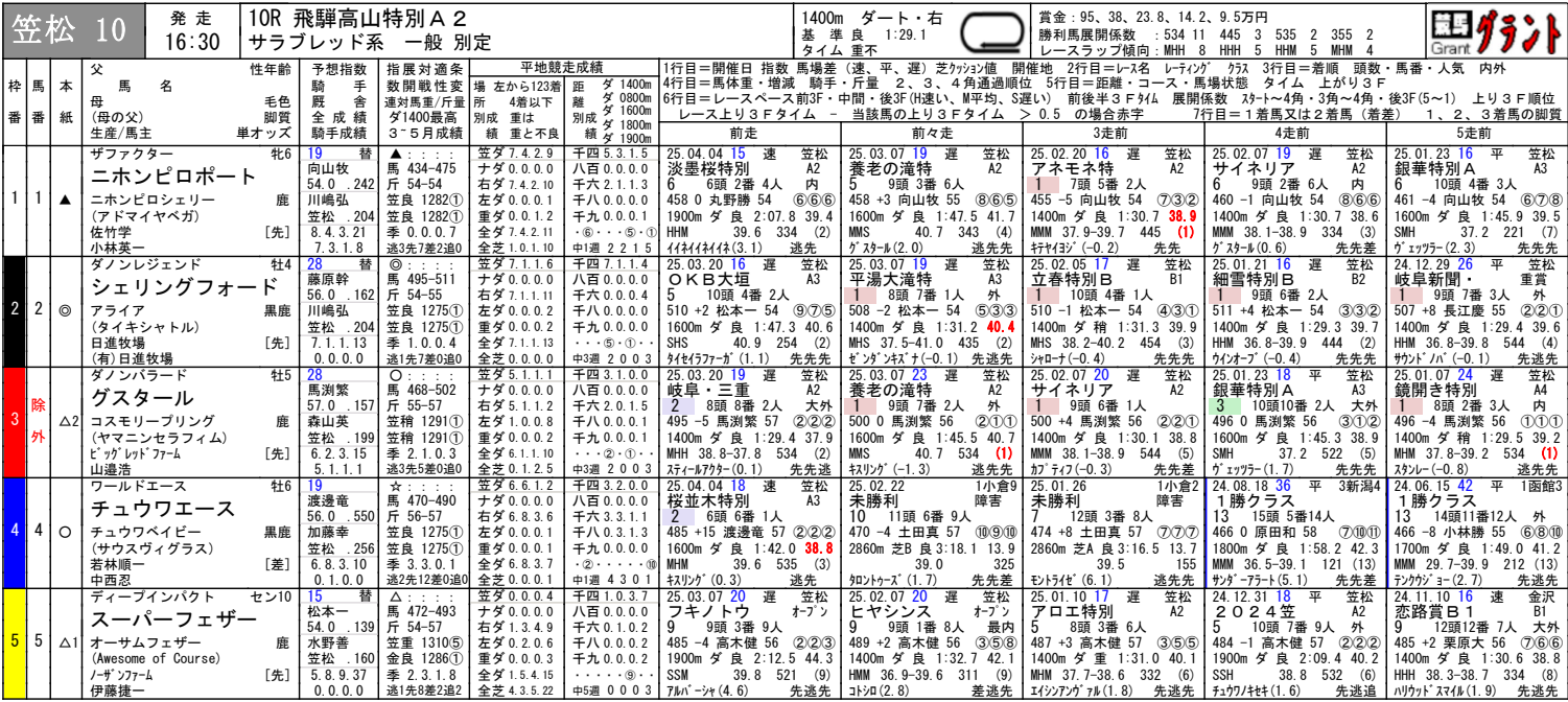
笠松ダート1400m騎手成績