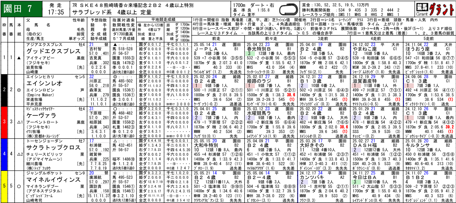
園田ダート1700m騎手成績