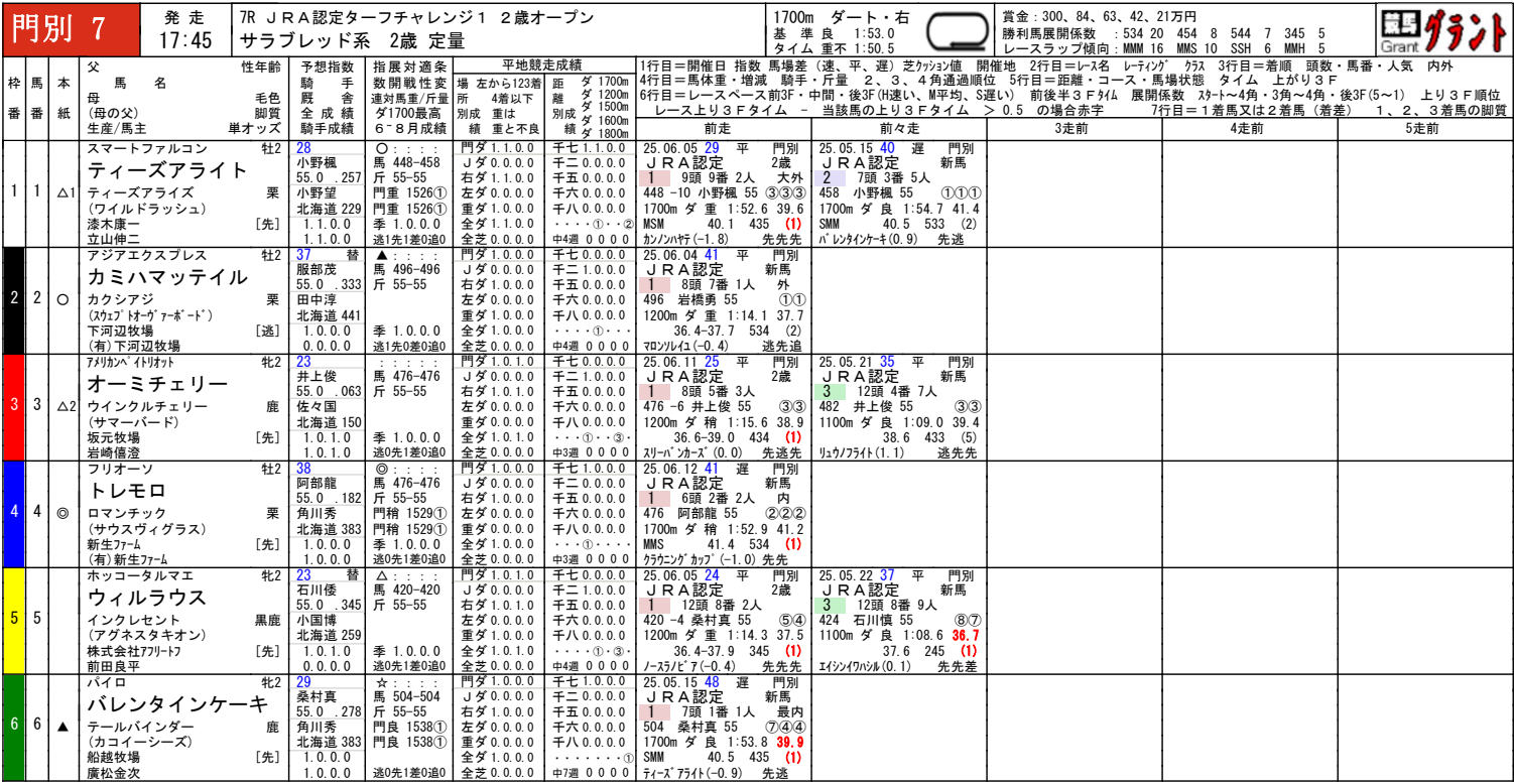
門別ダート1700m騎手成績