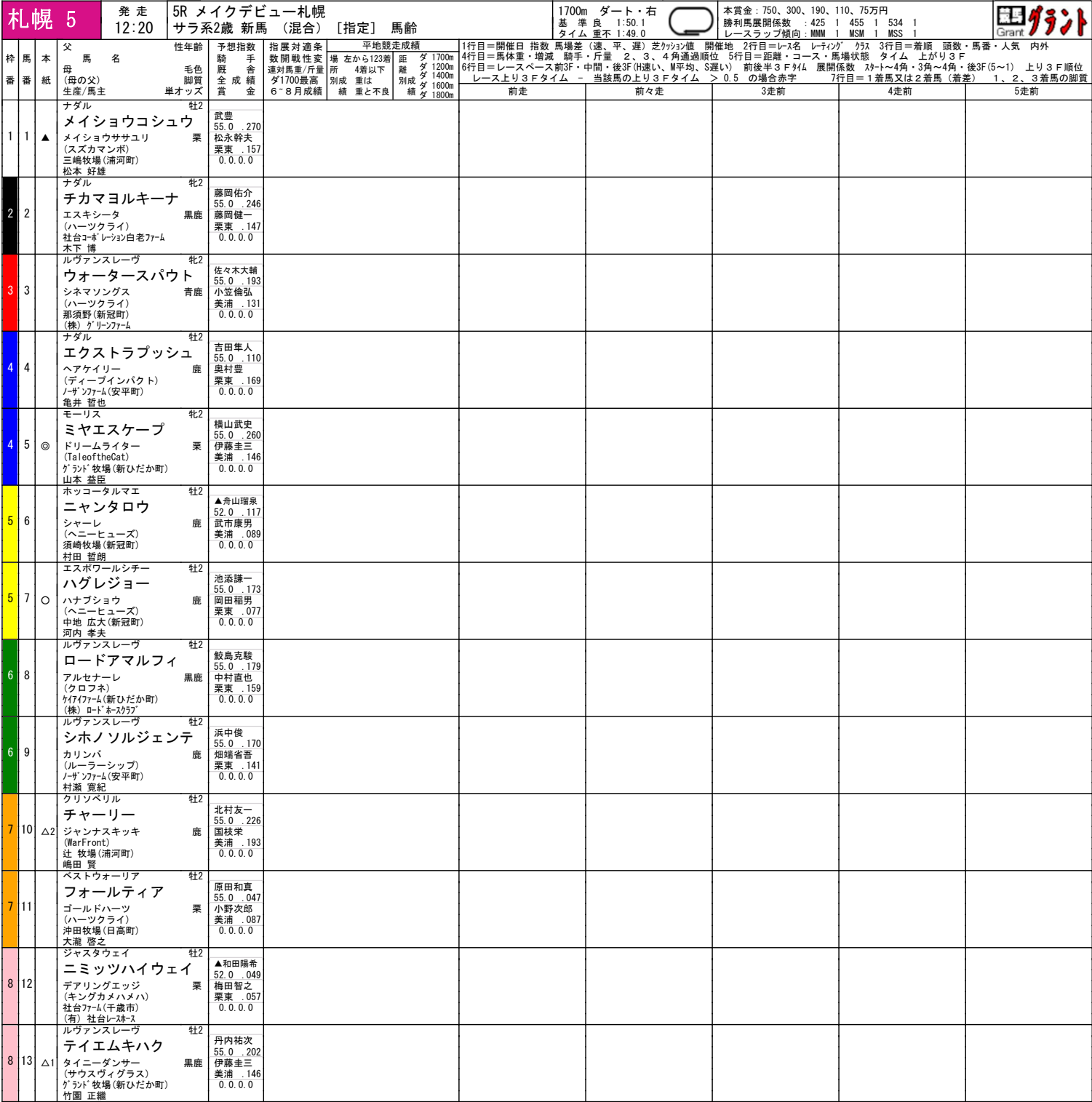
札幌ダート1700m騎手成績