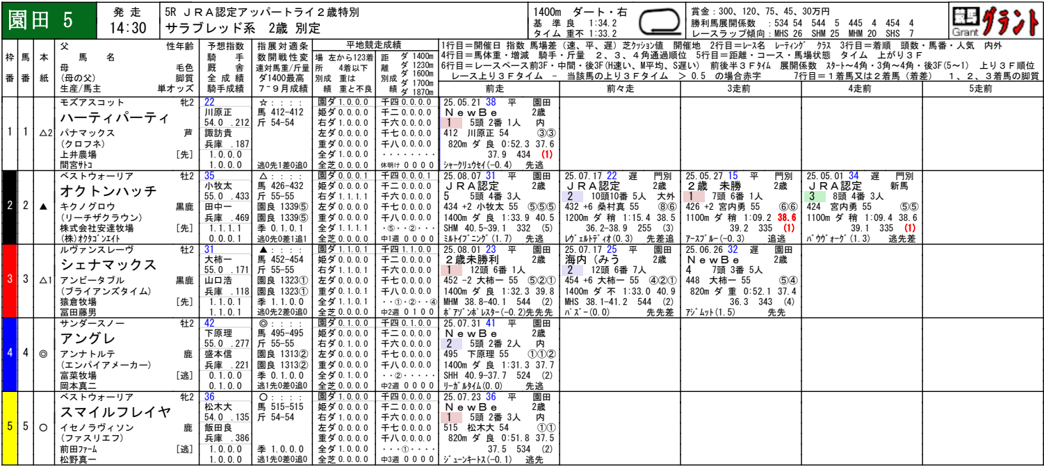
園田ダート1400m騎手成績