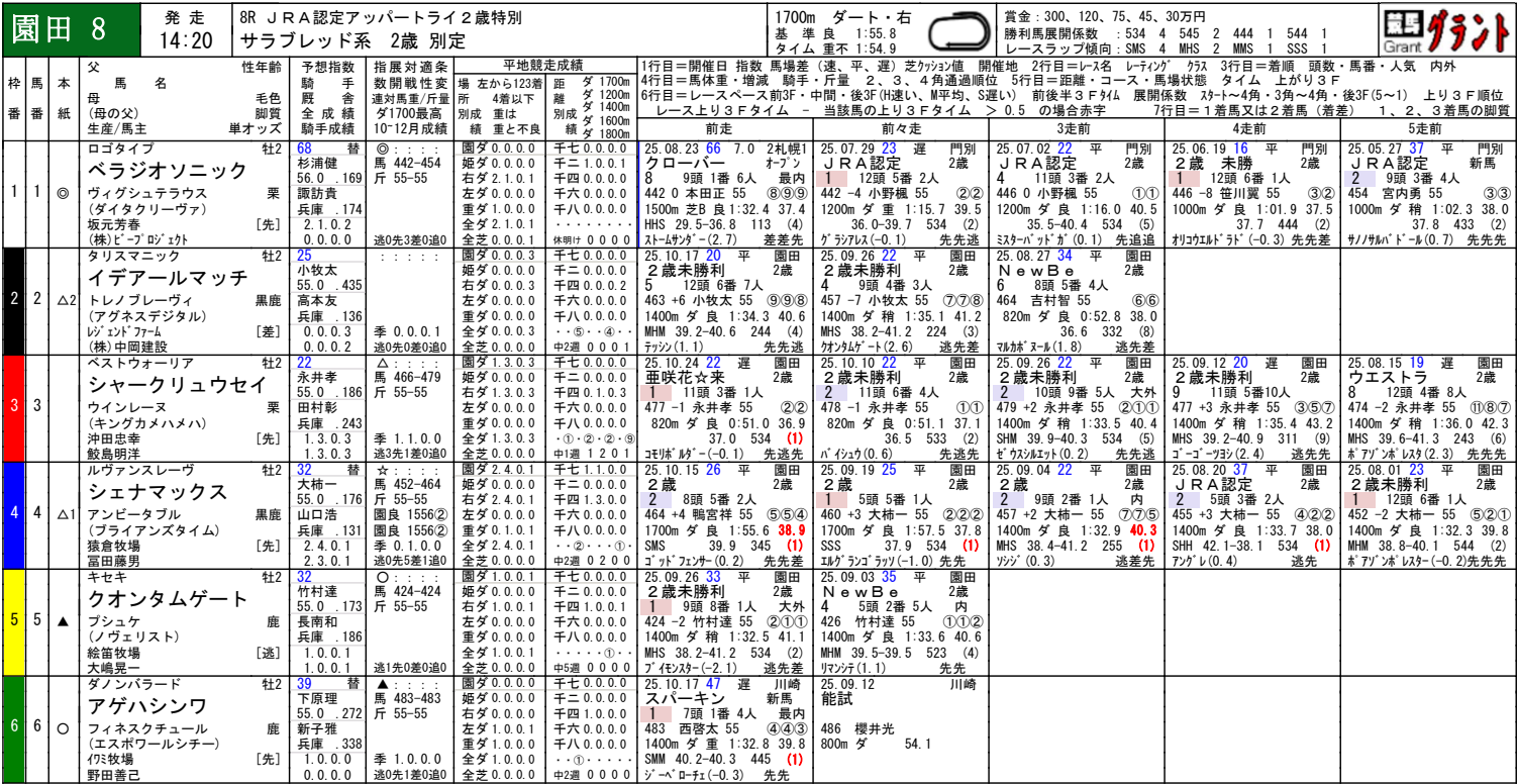
園田ダート1700m騎手成績