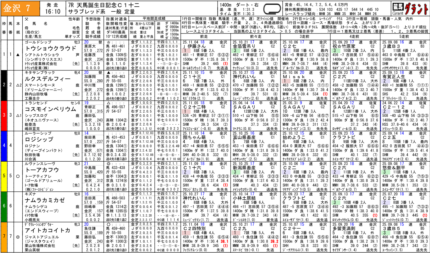
金沢ダート1400m騎手成績