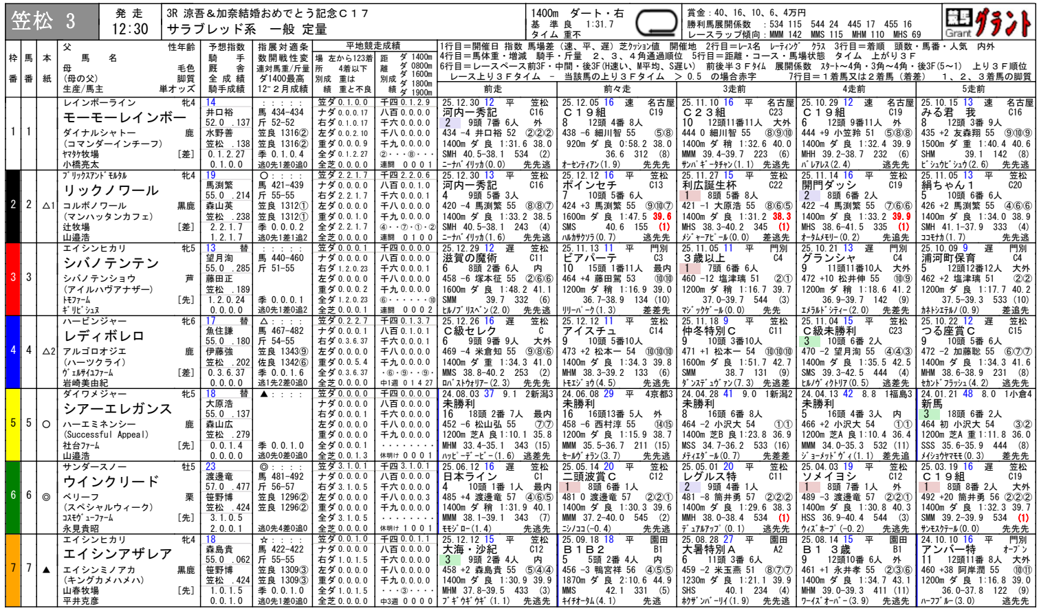
笠松ダート1400m騎手成績